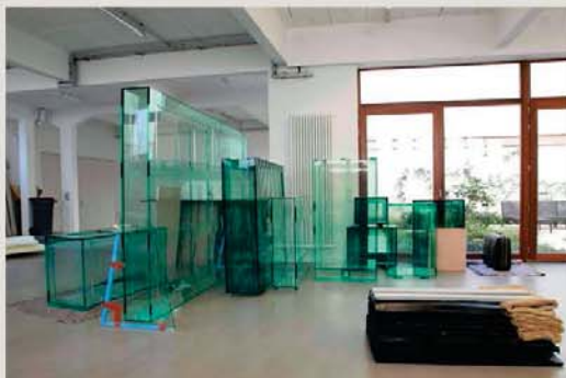
Un'opera di Tatiana Trouvé

● GAGOSIAN GALLERY , via F. Crispi 16; tel. 06-42086498. Orario: 10,30-19; chiuso lunedì e festivi; dal 22, alle ore 18, e fino al 4 gennaio