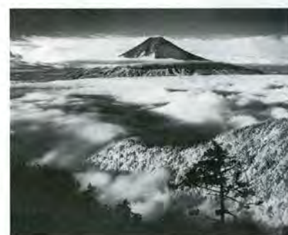
68 Tashkentale 2012