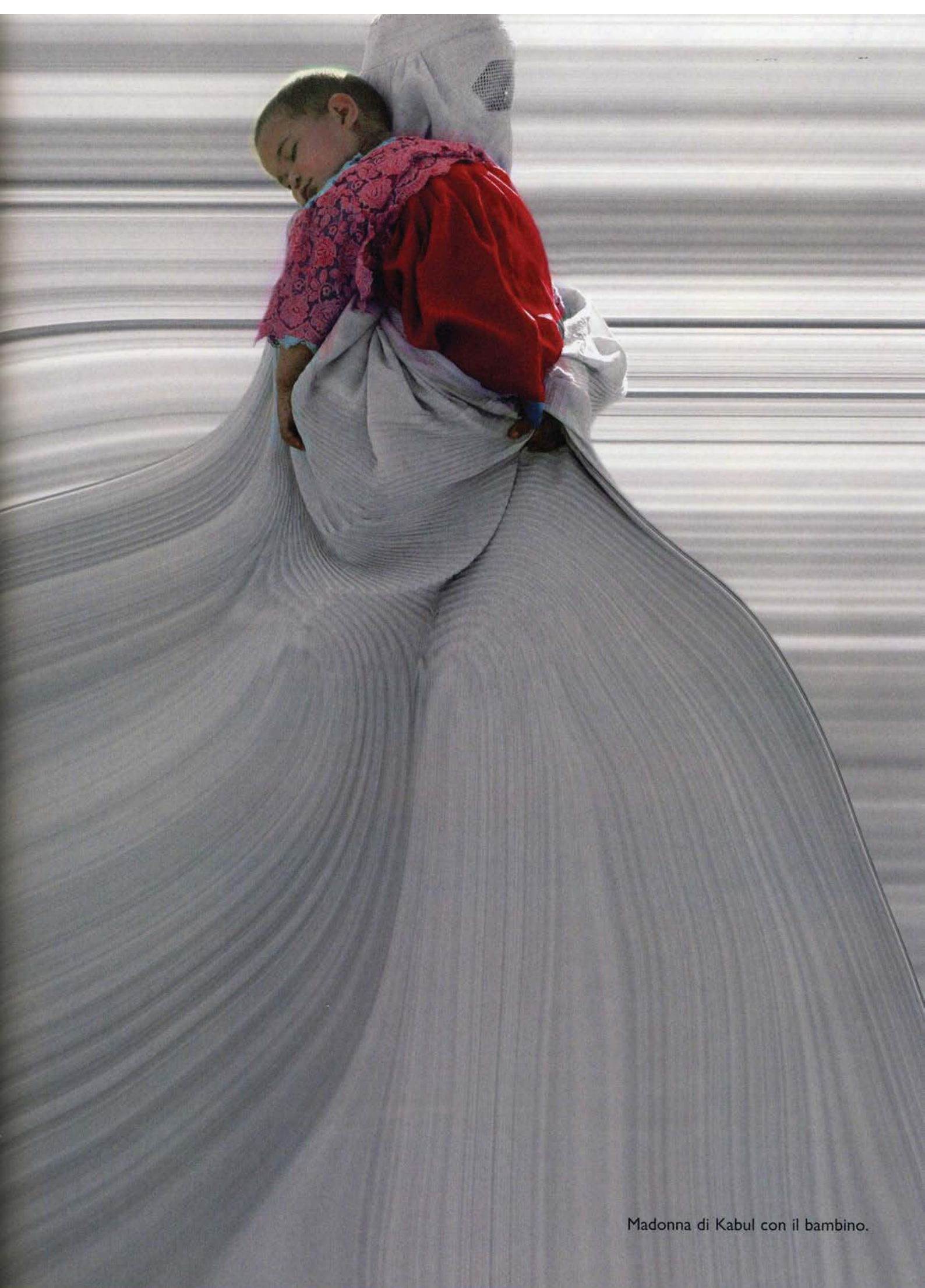
Madonna di Kabul con il bambino.