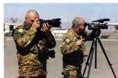
60 I fotografi con le stellette