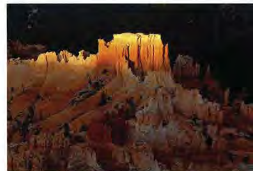
50 Le ore della fotografia