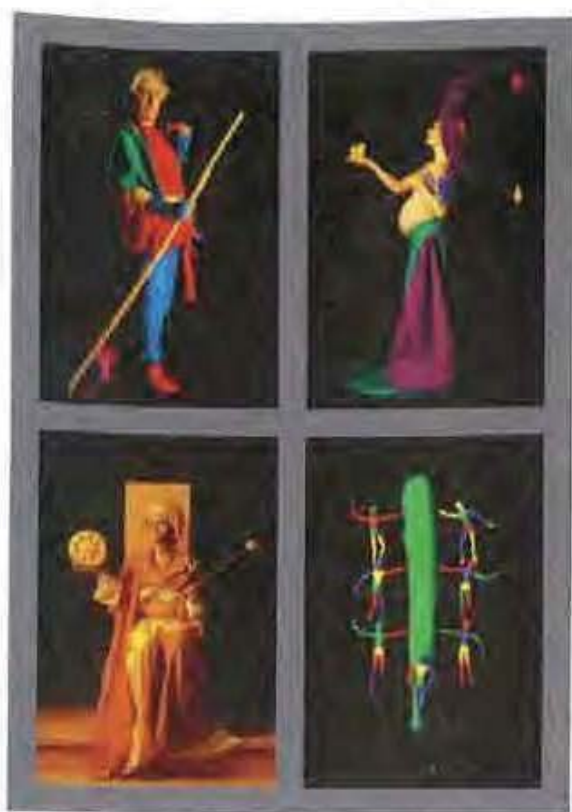
161 Le Fou, la Lune, la reine de Denier, le 7 de Bâton.